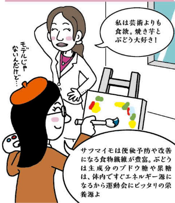
なぞなぞ原案:このゆみ(T&Yなぞなぞ)