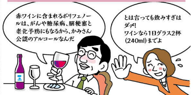
製菓=幸野◎:9.27上 (原案)=高十郎◎:Y字 漫画の絵⇒野村の絵◎:上玉 監修